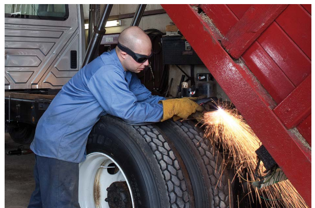
Reparación y modificación de vehículos