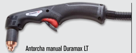
Antorcha manual Duramax LT