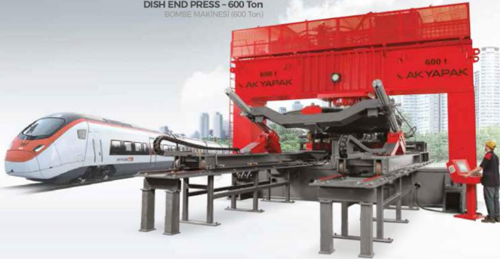
DISH END PRESS – 600 Ton BOMBE MAKİNESİ (600 Ton)