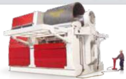
PLATE ROLLS SİLİNDİR BÜKME MAKİNELERİ