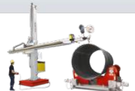
WELDING SOLUTIONS KAYNAK ÇÖZÜMLERİ