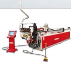
PIPE & TUBE BENDING MACHINES BORU BÜKME MAKİNELERİ