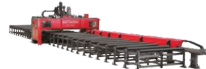
COMBINED DRILLING & OXY-FUEL/PLAZMA CUTTING MACHINES KOMBİNE DELİK DELME VE OKSİJEN/PLAZMA KESİM MAKİNELERİ