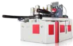
ANGLE ROLLS PROFİL BÜKME MAKİNELERİ