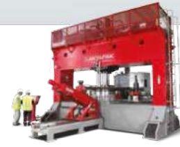
DISHING PRESSES BOMBE PRESLERİ