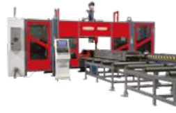
3 SPINDLE WITH SUB-AXIS DRILL LINES YAN EKSENLİ 3 SPİNDLE DELİK DELME HATTI