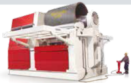
PLATE ROLLS SİLİNDİR BÜKME MAKİNELERİ