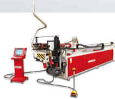
PIPE & TUBE BENDING MACHINES BORU BÜKME MAKİNELERİ