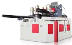
ANGLE ROLLS PROFİL BÜKME MAKİNELERİ