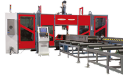
YAN EKSENLİ 3 SPİNDLE DELİK DELME HATTI