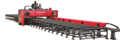
COMBINED DRILLING & OXY-FUEL/PLAZMA CUTTING MACHINES KOMBİNE DELİK DELME VE OKSİJEN/PLAZMA KESİM MAKİNELERİ