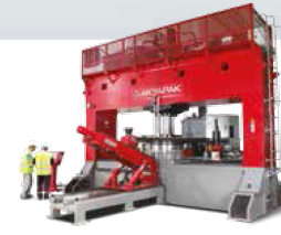
DISHING PRESSES BOMBE PRESLERİ