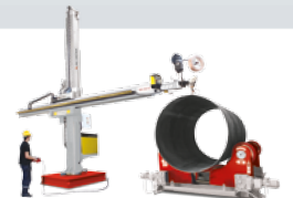
WELDING SOLUTIONS KAYNAK ÇÖZÜMLERİ